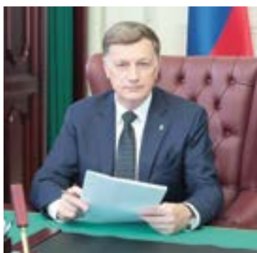
Депутат Государственной Думы Федерального Собрания Российской Федерации Вячеслав Макаров