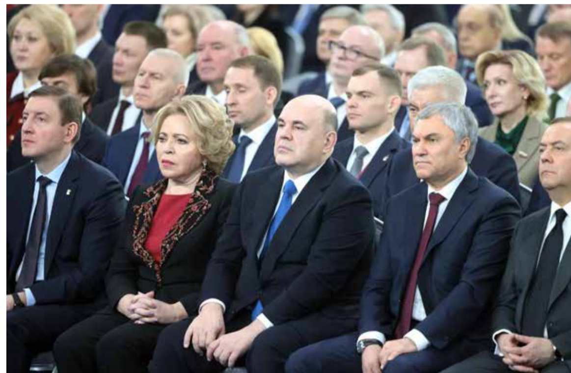
Во время оглашения Послания Президента Федеральному Собранию

• В сферу жилищно-коммунального хозяйства в России вложат не менее 4,5 триллиона рублей в следующие 10 лет.