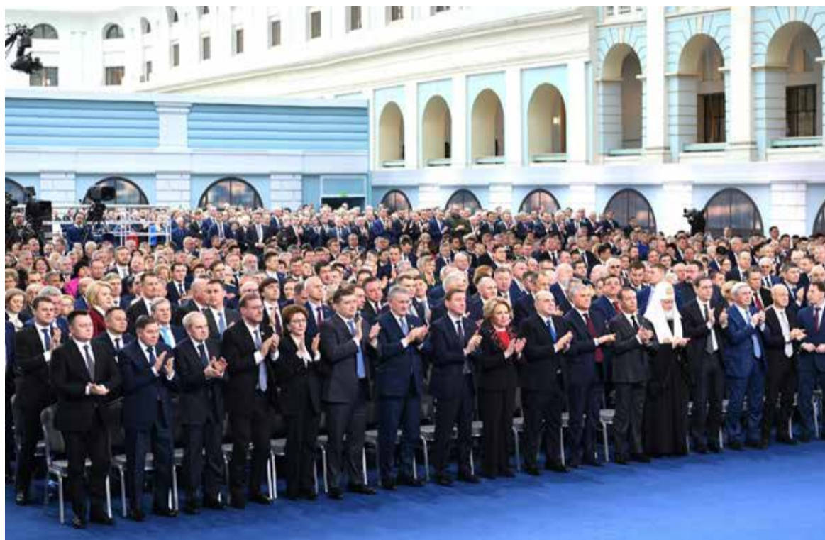
Перед началом церемонии оглашения Послания Президента Федеральному Собранию.

• Несмотря на экономический спад во втором квартале 2022 года, серьезный подъем