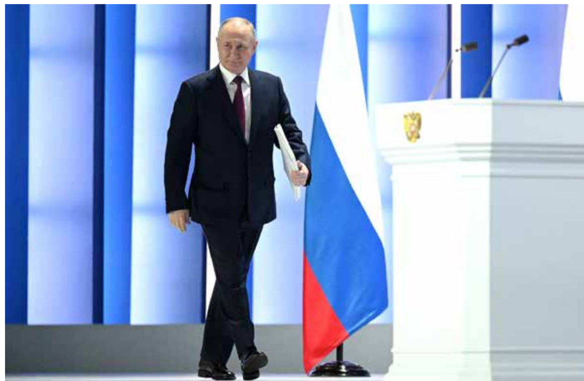
Перед началом церемонии оглашения Послания Президента Федеральному Собранию.

• Элиты Запада не скрывают своей цели – нанести стратегическое поражение России. Они намерены перенести локальный конфликт в фазу глобального противостояния.