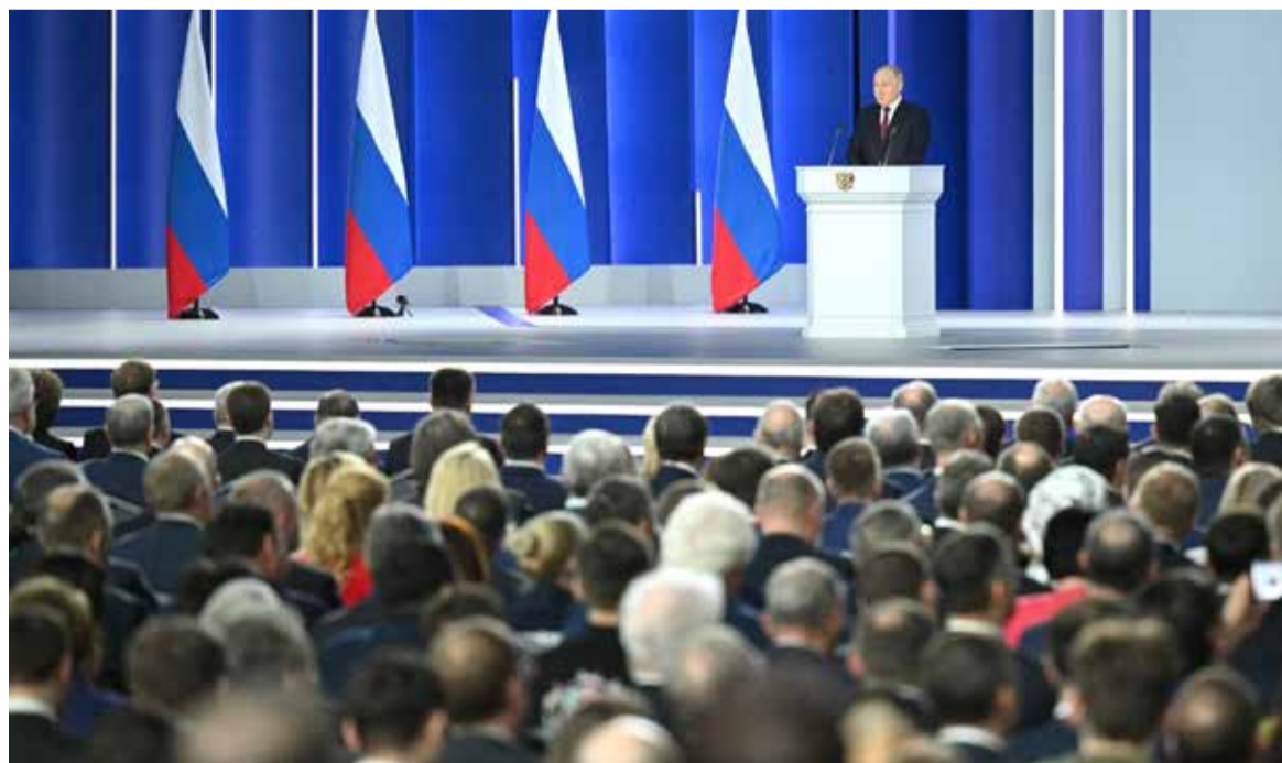
Послание Президента Федеральному Собранию.

• Необходимо объединить все лучшее, что было в совет-