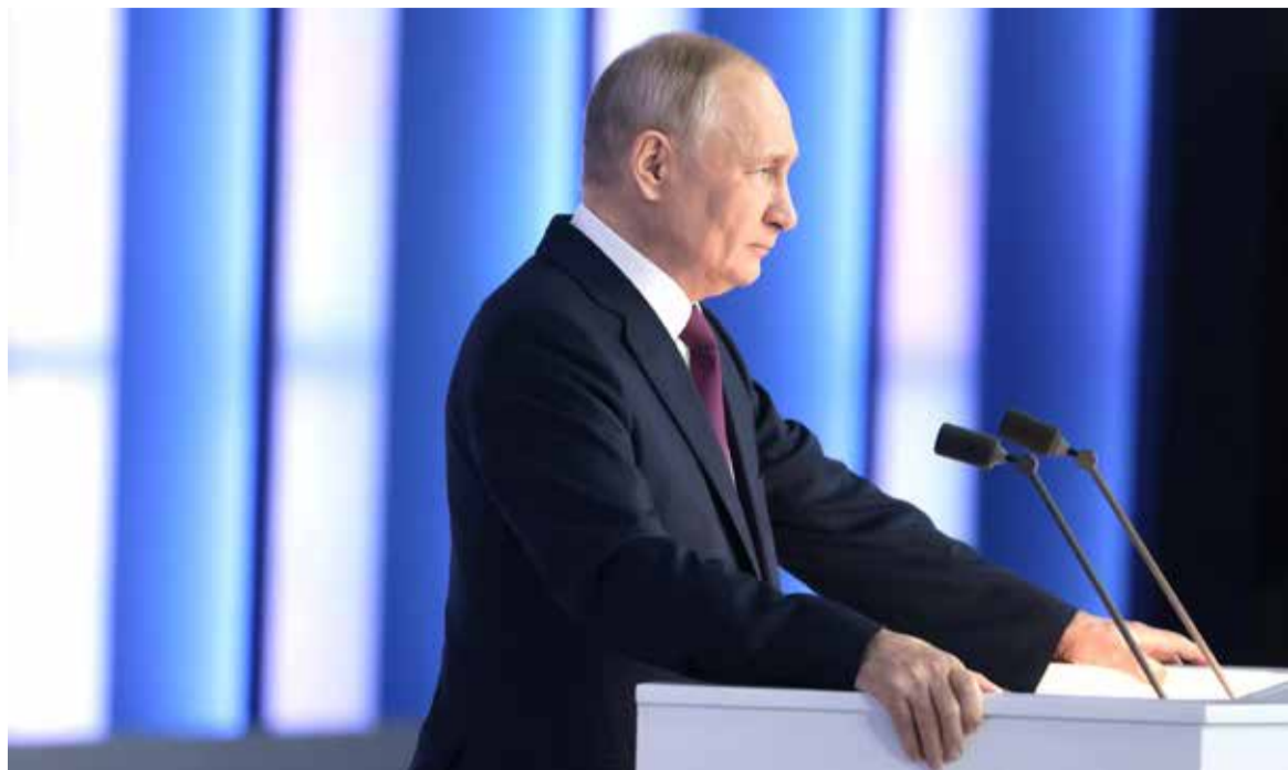
Во время оглашения Послания Президента Федеральному Собранию.

был зафиксирован уже в третьем и четвертом кварталах. Россия фактически вышла на новый цикл роста экономики. По оценкам специалистов, его модель, структура обретают качественно иной характер. На первый план выходят новые перспективные глобальные рынки, включая АТР, собственный внутренний рынок, научная, технологическая, кадровая база, не поставки сырья за рубеж, а производство товаров с высокой добавленной стоимостью.