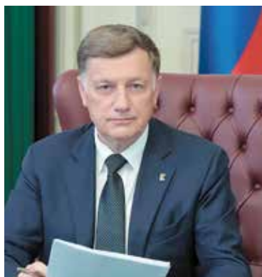
Депутат Государственной Думы Федерального Собрания Российской Федерации Вячеслав Макаров

Материнская любовь и забота всегда были фундаментом семьи, основой воспитания детей и гармонического развития личности. Вы — надежная опора общества и государства. Без женской интуиции и организаторского таланта трудно представить развитие современной науки, педагогики, здравоохранения, социальной сферы, предпринимательства. Сегодня российские женщины дости-