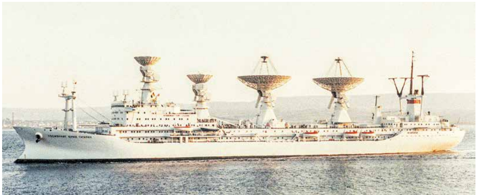
Советское научно-исследовательское судно «Космонавт Юрий Гагарин»

Всю оставшуюся часть рейса он занимался разбором библиотеки, просушиванием документации и книг, да переживаниями по поводу своей судьбы. Которая оказалась незавидной – его отчислили с судна и отправили служить в самую далекую часть Сибири.