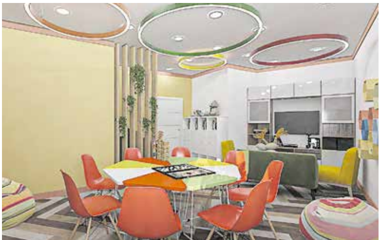
Проект нового стационарного отделения на Каменноостровском, 53

По вопросам социального обслуживания и порядку оказания социальных услуг и иных мер социальной поддержки можно обратиться по адресу: Гатчинская улица, 35, литер А, кабинеты № 103 и № 105. Телефоны: 573-98-20, 573-98-21, 573-98-31