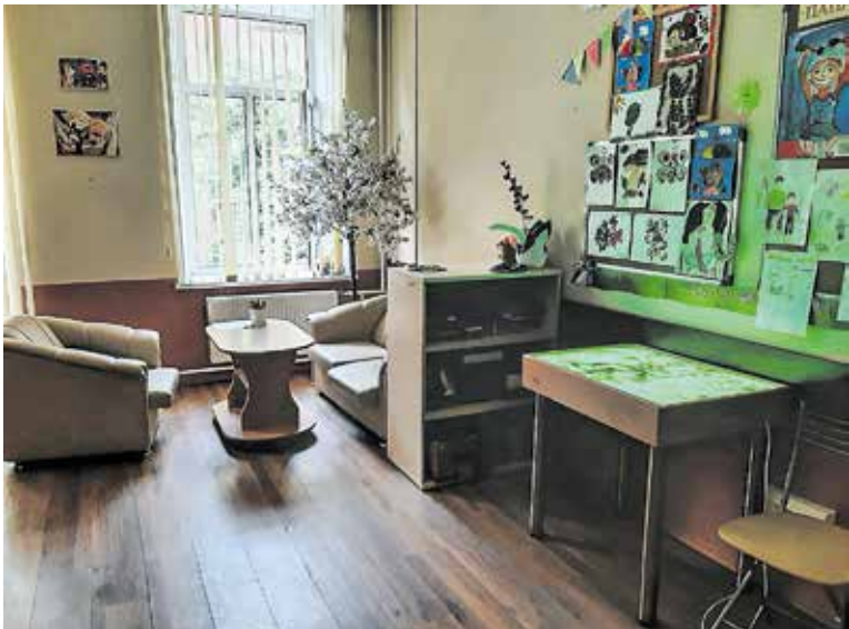
Кабинет психологических консультаций и занятий

организации экскурсий, мастер-классов, выездов на природу и так далее. Все услуги оказываются бесплатно. Многие семьи обращаются в Центр,