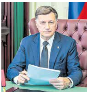
Депутат Государственной Думы Федерального Собрания Российской Федерации Вячеслав Макаров

Мы низко кланяемся всем, кто защищал осажденный город с оружием в руках, кто трудил-