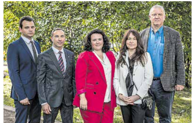
Депутаты Муниципального Совета МО округ Петровский»

Ближе к вечеру ведущие открыли площадку, на которой каждый желающий мог от души потанцевать под звуки романтического саксофо-