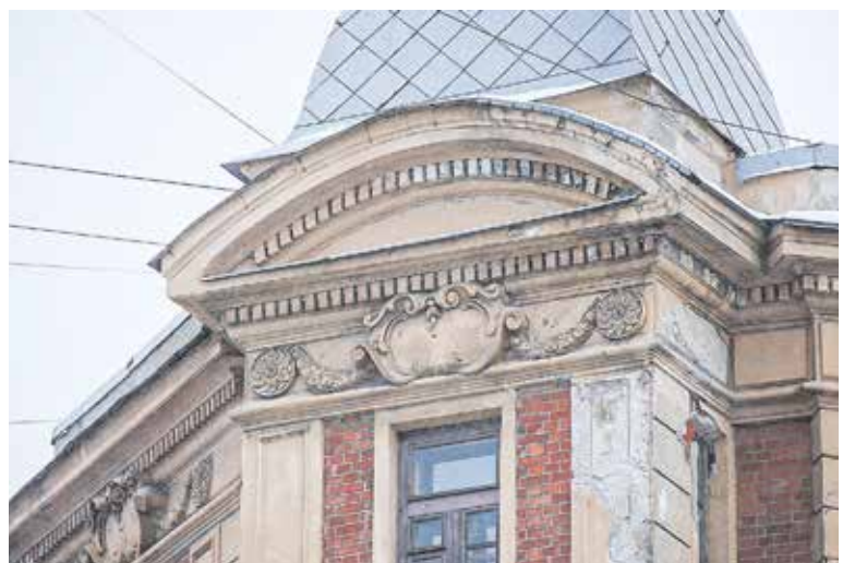
Дом квартир Императорского человеколюбивого общества