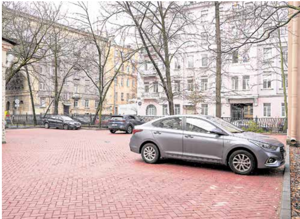
После Ждановская, 11