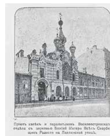
Церковь иконы Божьей Матери Всех Скорбящих Радость при приюте на Лахтинской ул., 10-12. 1909 год.