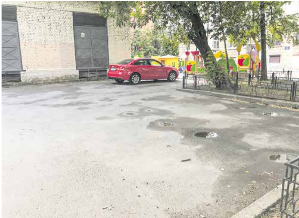
До Ждановская, 11