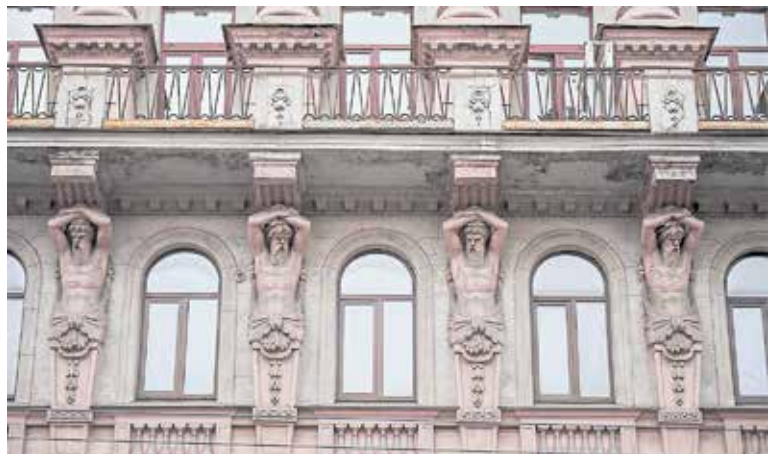
Дом со спрятанными сфинксами

Загадочный северный замок на Большом проспекте Петроградской стороны, 44, спроектирован и построен архитектором со шведскими корнями, безусловно, черпавшим вдохновение в скандинавской архитектуре. Порталы в готическом стиле, монументальность входной группы и вырезанные из кам-