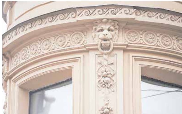
«Дом со львами»

В Петербург маскароны пришли во времена пышного барокко. На многих петербургских зданиях размещены не только маски львов, но и кольца. Одним из ярких примеров могут служить львы, украшающие угловое здание на Большом проспекте Петроградской стороны, 13. Ба-