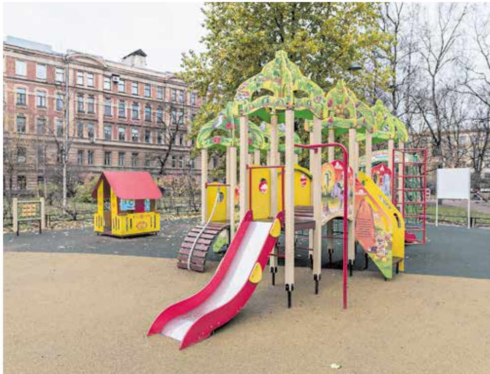
После Большая Зеленина, 13