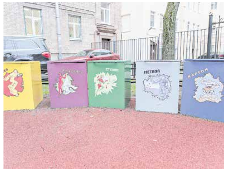
После Лахтинская, 3