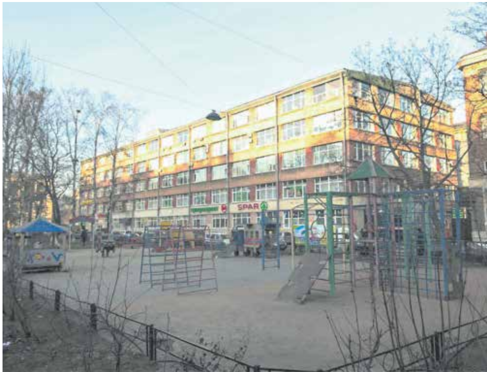
До Большая Зеленина, 13