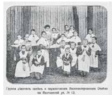
Воспитанницы приюта для детей-калек и паралитиков на Лахтинской ул., 10-12. Ок. 1890 г.