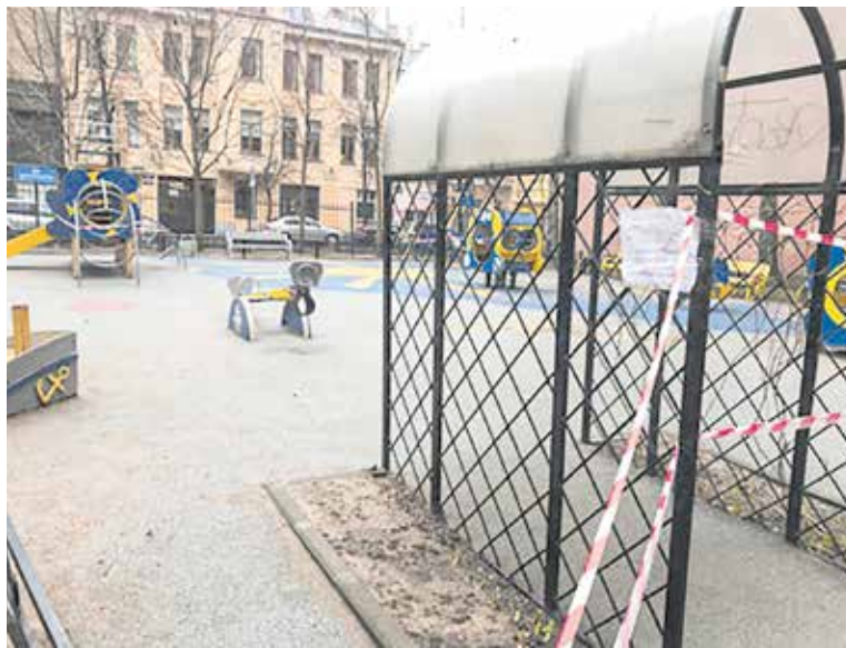
До Лахтинская, 3

Вопросу раздельного сбора мусора в муниципалитете уделяют особое внимание. Практически на каждой контейнерной площадке стоят специальные баки. Один для стекла, другой для бумаги и картона. Из каждого отходы собирает специальная машина, потом все везут на заводы, где старым коробкам и банкам дают вторую жизнь. Примечательно, что в специальной экологической программе участвуют сразу несколько детских садов. Например, к культуре раздельного сбора мусора своих воспитанников приучает дошкольное учреждение на улице Ленина, дом 20. Там рядом с игровой площадкой установлены детские контейнеры. Все происходит в игровой форме: воспитатели рассказывают, во что может превратиться бутылка из-под минеральной воды, если ее правильно утилизировать, а потом переработать.