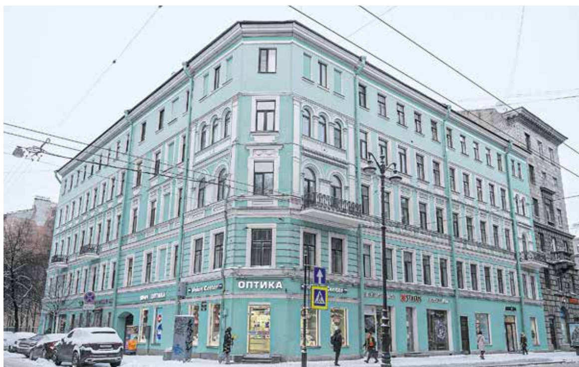
«Дом образцового содержания» на Лахтинской ул., 1/60, лит. А.

— Чтобы получить хороший результат, пришлось потратить много времени и сил. Изначально наш дом входил в региональную программу капремонта. Но сроки выполнения были давно пропущены. Мы сумели актуализировать их, с тех пор в доме выполни-