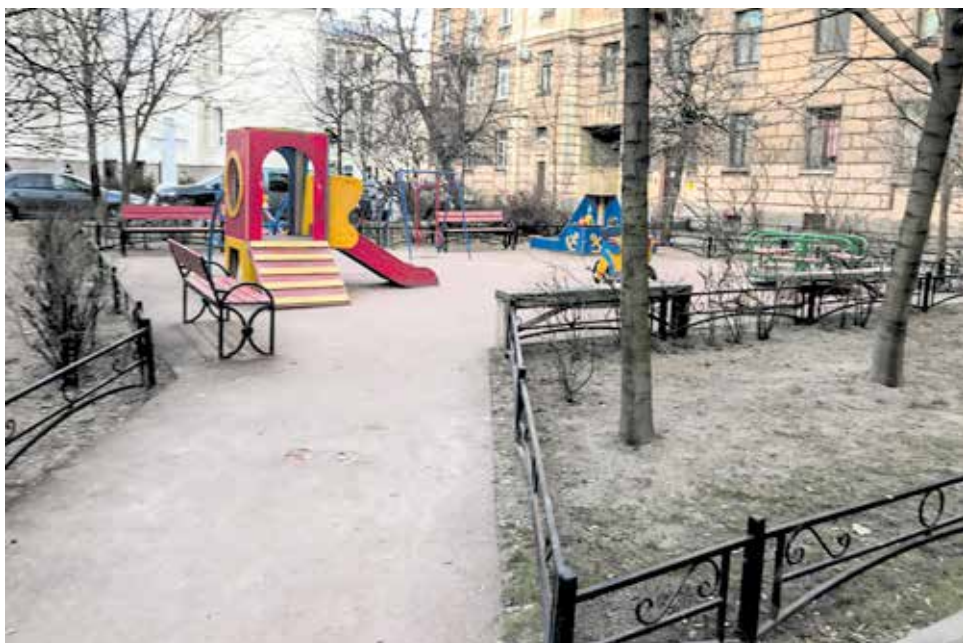
До Лахтинская, 17