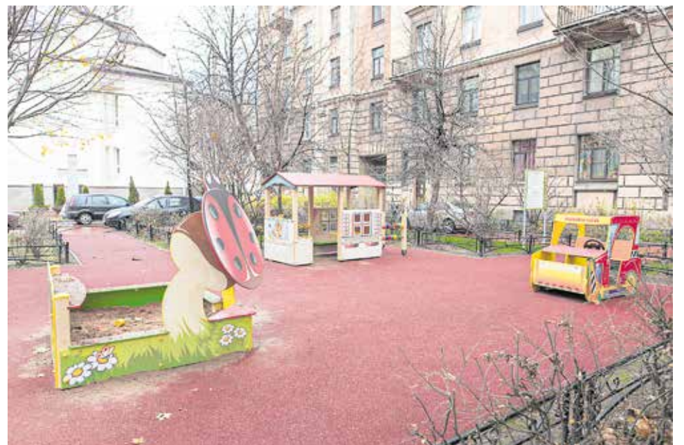
После Лахтинская, 17