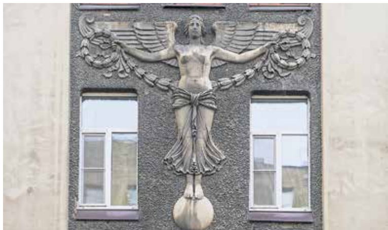
«Дом с ангелом»