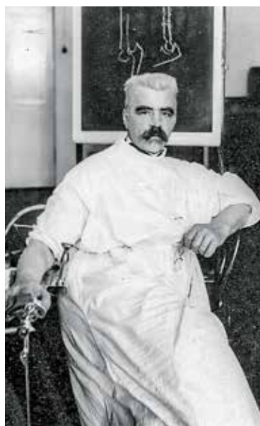
Доктор медицины, профессор Г. И. Турнер