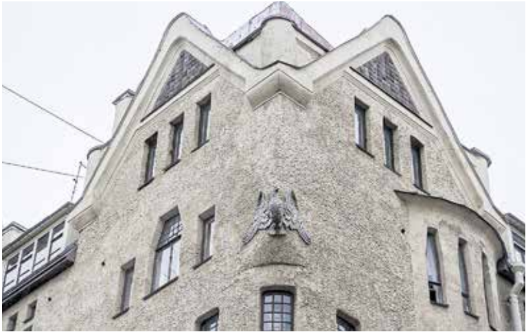
«Дом с совами»

Визуальные эффекты, созданные мастером модерна, одним из самых экстравагантных архитекторов Петербурга, ошеломляют. Лидваль сотворил из камня и штукатурки, полета мысли и архитектурного эксперимента ощущение северного замка на краю утеса, в окруже-