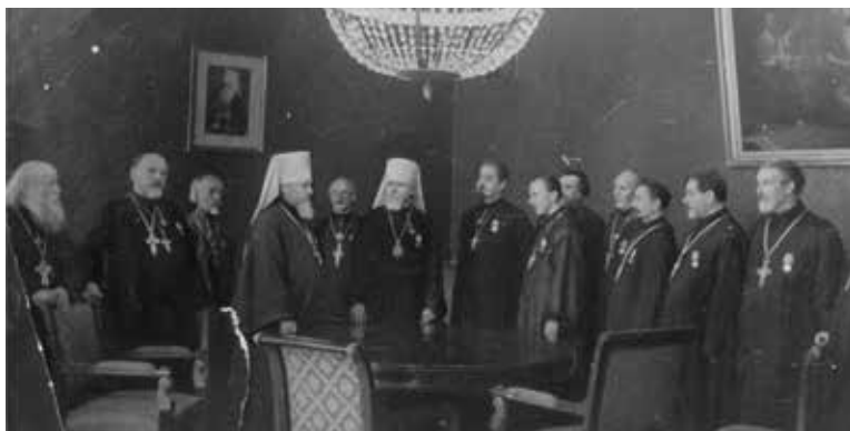
1944 год, город Москва. Московское духовенство с Патриаршим местоблюстителем митрополитом Ленинградским и Новгородским Алексием в день награждения медалями «За оборону Москвы»

Это лишь несколько из тысяч примеров того, что православная церковь всегда была рядом со своим народом и вместе с ним переносила тяготы и лишения. Посетить тематическую выставку в храме святой блаженной Ксении Петербургской можно до 8 февраля.