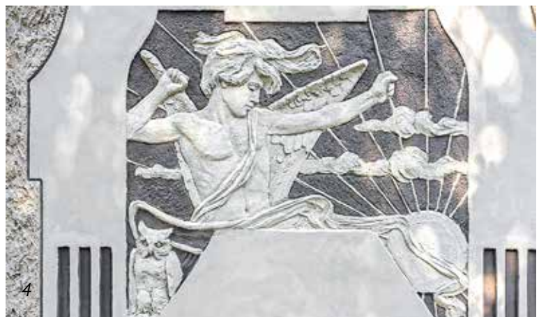
Фото 3 и 4. Доходный дом Иды Лидваль

Важными трактатами о символизме в России можно назвать два издания, на основе которых формировалась российская геральдика, гравюры, мебель, фасады зданий и отдельно взятые архитектурные элементы. Первая книга была отпечатана в 1705 году в Амстердаме по личному приказу Петра I числом примерно 800 экземпляров и называлась «Символы и Эмблемата» («Symbola et Emblemata», типография Henricum Wetstenium). Она была основана на более раннем издании Даниэля де ла Фея (Амстердам, 1696). Второй книгой стала «Емвлемы и символы избранные» 1788 года, написанная известным в Петербурге врачом Нестором Максимовичем Максимовичем-Амбодиком. В своих трудах Максимович-Амбодик постоянно упоминал символ солнца и называл великое светило «знаком истины, правды, премудрости, Провидения, плодородия и изобилия плодов земных». Он утверждал, что именно с солнцем связывается будущее, которое «представляется солнцем, являющимся в своей колеснице, пред коим едет Аврора...».