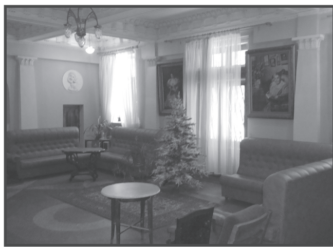
Холл Дома ветеранов сцены им. М.Г. Савиной