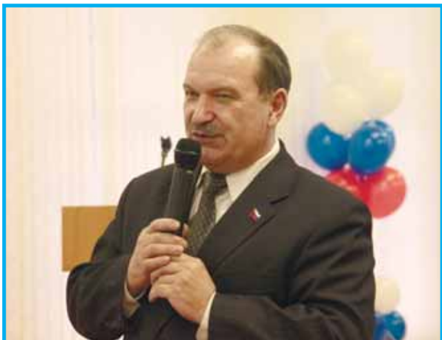
Уважаемые жители округа Петровский!

Представляю Вашему вниманию свой ежегодный отчет. В соответствии с Уставом у нашего муниципального образования 43 предмета ведения. Традиционно наиболее важным и финансово емким является «осуществление благоустройства территории МО» и обычно отчет главы строится вокруг исполнения этого, безусловно важного для населения полномочия.