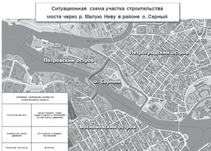
Архитектурное решение моста через р. Малую Неву