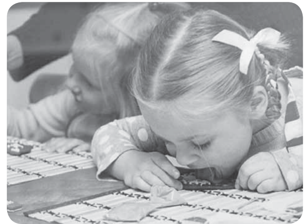
Роспись пряников для детей бывает испытанием

- Любят заказывать для детей роспись козуль. Козуль- это архангельский пряник, приготовленный по старинному рецепту. За счет количества специй в тесте, они очень долго сохраняют свои качества, то есть если через год вы его откроете, он будет такой же мягкий и ароматный. Пряники мы расписываем цветной или белой глазурью. Роспись можно делать на разные формы, допустим, на Новый год используем снеговиков, а на Пасху у нас были цыплята. Это популярный мастер-класс, его любят и дети, и взрослые. А для совсем маленьких ребят это целое испытание, потому что малыши, когда нюхают это лакомство, понимают, что сахарная глазурь- это сладенькое и вкусное и вместо того, чтобы заниматься расписыванием пряника, они начинают по-тихонько отламывать кусочки, облизывают пакетик с глазурью, в итоге пряник уничтожается еще не украшенным.