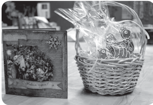
Открытка, сделанная по технике скрапбукинг и корзина с расписанными пряниками

-Декупаж. Это декорирование. Старинная техника, родилась из желания людей, которые не умели рисовать, саму роспись симитировать. Кстати, Мария Антуанетта декорировала свою мебель таким способом. На поверхность наносится либо декупажные карты- картинки, распечатанные на очень тонкой бумаге, либо салфетки. Границы рисунка из-за тонкости на изделии ощущаться не будут. Издалека кажется, что рисунок нарисован. Техника со временем усложняется- это становится не просто вырезанием и наклеиванием картинок, а подрисовкой, созданием эффекта старины. Благодаря совершенствованию материалов можно легко сочетать между собой техники. Например, с декупажем скрапбукинг - это создание альбомов, открыток из обрезков чего либо, старых цветков, бусинок. В общем, из того, что дома можно было найти и задекорировать - сделать красивую открытку или рамку. Со временем индустрия выросла настолько, что все маленькие отдельные штучки продаются отдельно за бешеные деньги и делается не из того, что дома есть- обрезков ленточек и кружев, а из специальных тех же самых лент, которые куплены в тон бумаги. В скрапбукинге есть техника штампинг - создание штампов в виде красивых рисунков. Это перекочевало и в технику изготовления материалов из пластика, ведь сам пластик мягкий, как пластилин, из-за этого легко делать штампы, запекать его и получать в итоге рельеф.