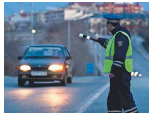
Начальник ОГИБДД УМВД России по Петроградскому району г. Санкт-Петербурга Невмержицкий А.Н.

По всем остальным нарушениям ПДД (кроме 11-ти перечисленных выше), независимо от их количества в течение года, в том числе по нарушениям со штрафом 500 рублей, в том числе превышения скорости на 20-40 км/ч.