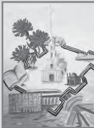
«Гиперболоид инженера Гагарина»