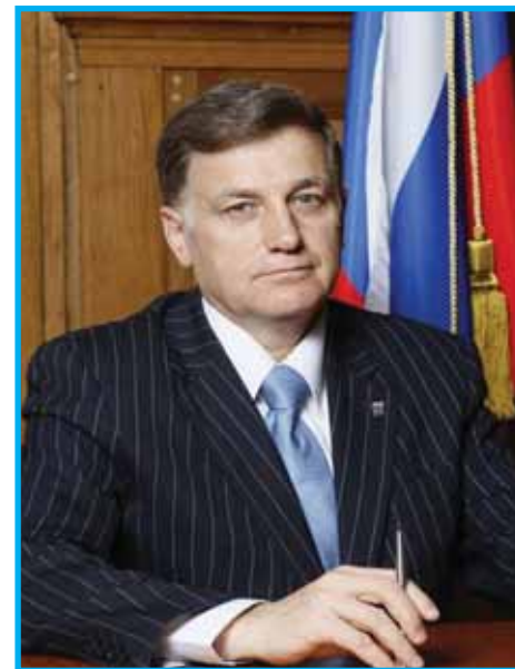
Секретарь Санкт-Петербургского регионального отделения Партии «Единая Россия», Председатель Законодательного Собрания Санкт-Петербурга Вячеслав Макаров

Успехи молодежи сегодня – это стабильность и процветание государства завтра».