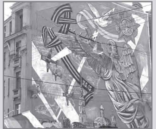
Роспись стены на Малом проспекте в День 70-летия Победы

Гагарина» (№13), которая заняла почётное 2-ое место. Хотя эта работа и не украсила стену дома на Малом проспекте 1Б, но она была представлена к почётной награде.