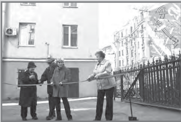
Торжественное открытие росписи стены на Малом проспекте

Напомним, что ранее МО округ Петровский объявило конкурс на лучшую роспись дома на Малом проспекте П.С. 1Б. Жюри предложили выбрать из всех предоставленных работ только одну, которая и будет взята за основу росписи дома на Малом проспекте. П.С. 1Б. По решению компетентного жюри, победителями данного конкурса, стали ребята из творческой группы